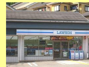
ローソン 静市市原店 (静市市原町)