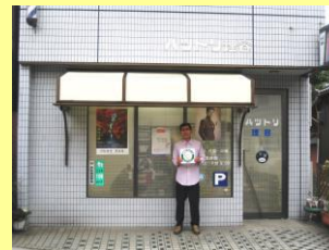
ハットリ理容 (下鴨松原町)