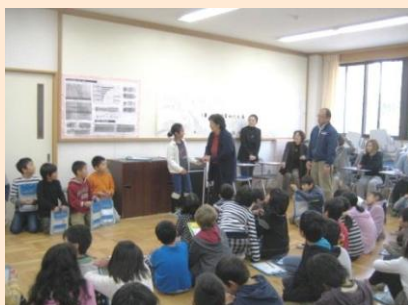
12/4 京都市市原野小学校4年生