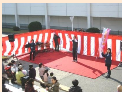
12/1 バザールいちはらの (市原野学区) 会場では、左京区地域介護予防推進センターと一 緒に公園体操を紹介しました