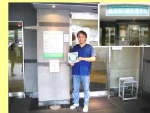
あおい鍼灸・整骨院 (下鴨東本町)