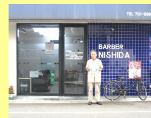
バーバー西田 (下鴨下川原町)