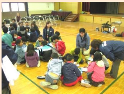
11/25 京都市葵小学校4年生