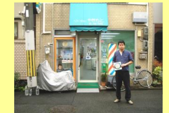
ヘアサロン やまもと (下鴨貴船町)

店長もしくは店員の1割以上の方がこの講座を受講・登録申請いただくと、高齢者にやさしい店として登録いただけます。