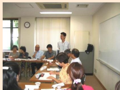
9/26 介護者の会 (市原野学区) デイケア (しずはうす)、特養ホーム (静原寮) から、ご家族への支援について報告がありました