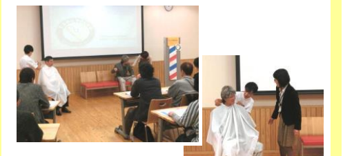
理容店組合による、高齢者にやさしい店講座の受講の様子です。 (平成25年11月11日)

次回の説明会・登録の講座は、 平成26年2月12日(水) PM 7:00~PM8:30 左京区役所で開催します。