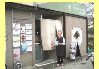
シャンプーヘアサロンひらの (下鴨梅ノ木町)