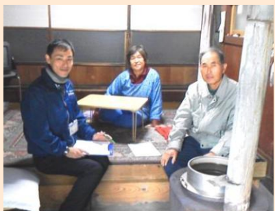
あんしんカードの更新ヒアリング 11/26 (広河原学区)、11/28 (別所学区)