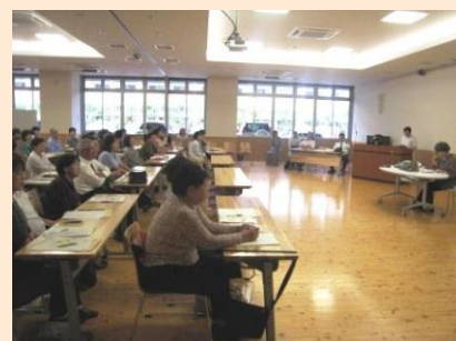
10/10 老人福祉員研修会 (左京区役所) 左京区の7包括の社会福祉士が、「悪徳商法」や 高齢者の見守りについて事例紹介をしました