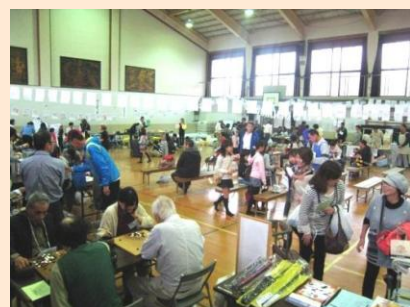
10/20 葵ふれあいひろば (葵学区) 今年は天候が悪く体育館での開催でしたが、たく さんの方の参加で盛会でした