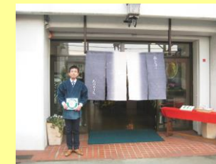
たけのうち 北山店 (下鴨南芝町)