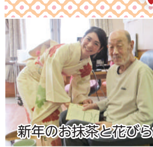
新年のお抹茶と花びら餅を頂きました。