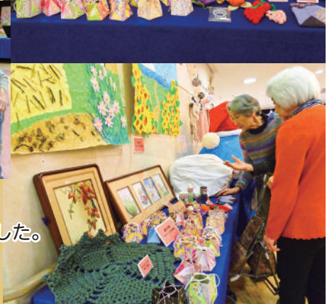
ロビーに入居者、花友しらかわをご利用される方々、地域の方々の作品を展示しました。個人の作品だけでなく共同製作もあり、いずれも力作ぞろいでした。どの作品にも思いがこもっていて、心が温くなる空間となりました。