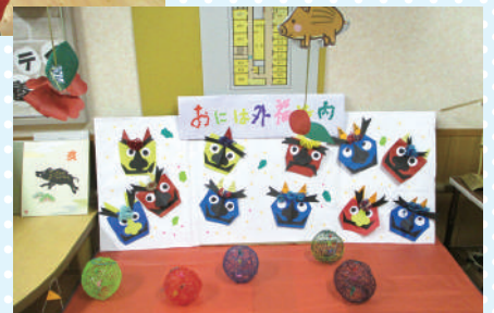
鬼は外！福は内！ 一年の無病息災を願って節分の豆まきを行いました。 今年も元気に過ごせそうです！