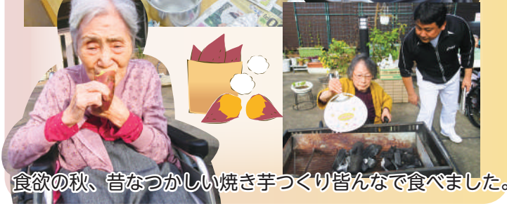
食欲の秋、昔なつかしい焼き芋づくり皆んなで食べました。